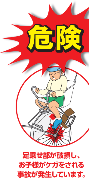
リコール対象商品(12モデル)の一例