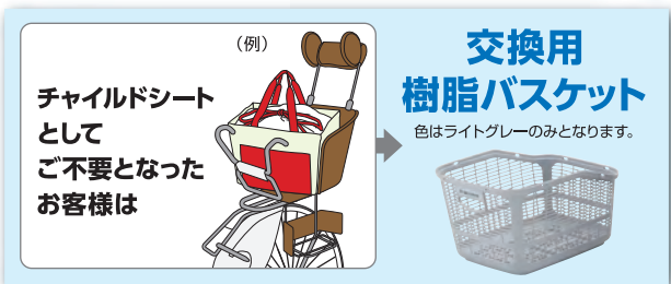
リコール対象商品 12モデル (色は一例です)