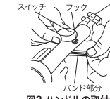
図3 ハンドルの取付例