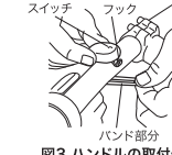
図3 ハンドルの取付例