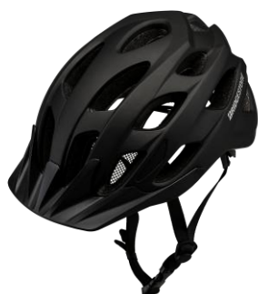
<ブラック (BL) >

ブリヂストンサイクル株式会社は、自転車用ヘルメット「Kamru (カムル)」を4月中旬に発売します。スポーティーな形状かつ幅広い層にマッチするシンプルなデザイン、軽量で、手に取りやすい価格により、ヘルメット着用率向上を後押しします。