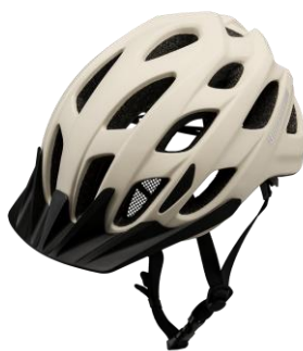
<ベージュ (BE) >