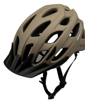
<ライトブラウン (LBR) >

2026年4月から、交通反則通告制度いわゆる「青切符」制度が自転車にも導入され、自転車の安全対策が注目されています。自転車を運転する際のヘルメット着用は、命を守るために非常に重要です。2020年から2024年までに発生した自転車乗車中の死亡事故では、死者の約5割が頭部を負傷していました。また、同期間に頭部を負傷した者のうち、ヘルメットを着用していなかった場合の致死率は、着用していた場合の約1.4倍となっています。