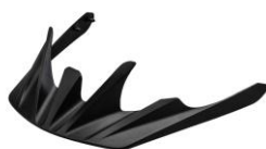
取り外し可能な樹脂製バイザー (補修用の別売設定あり)