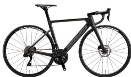
レーシングブラック