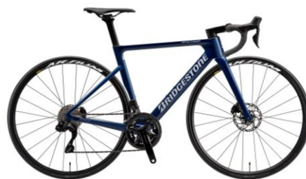
【2025年モデル限定カラー】 レーシングディープブルー