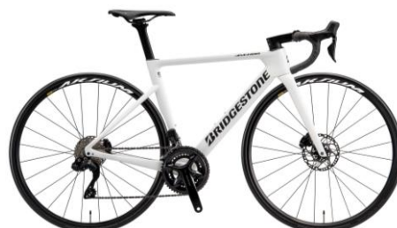
レーシングホワイト