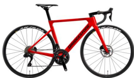
【2025年モデル限定カラー】 レーシングシャインレッド