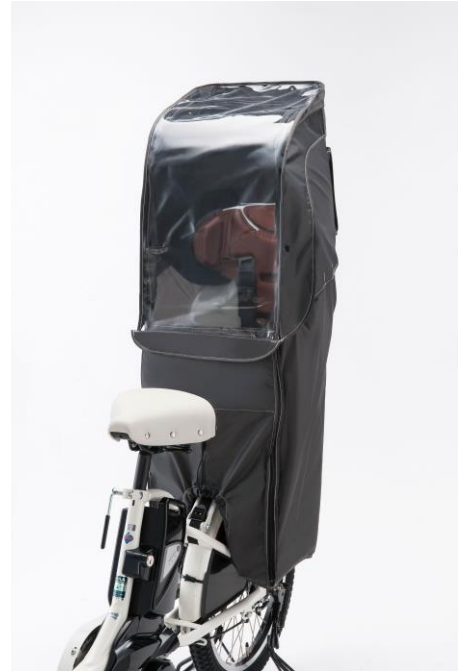
リヤチャイルドシートルーム