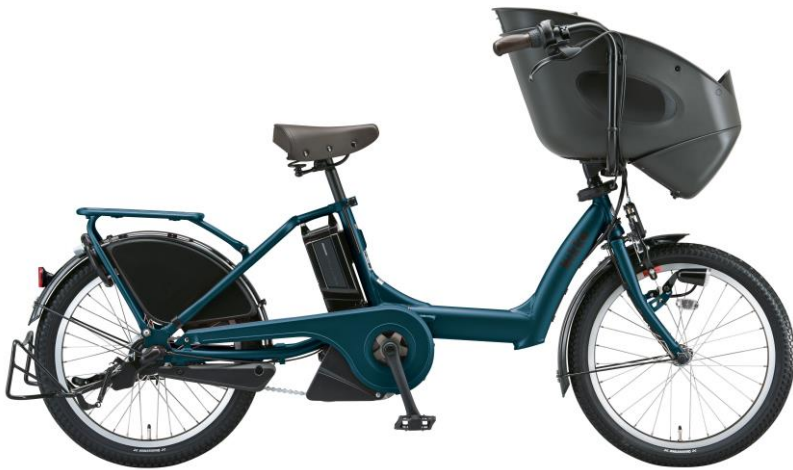
ビッケポーラーe T.X レトロブルー (ツヤ消しカラー)