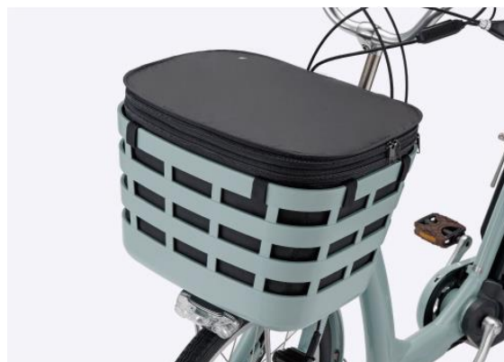
フロントスクエアバスケットカバー※