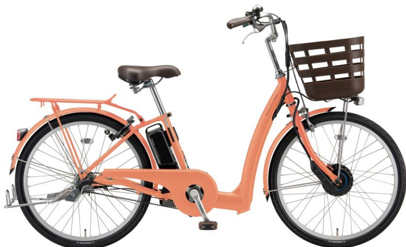
ラケット 24 インチ E.X サニーピンク

キャンペーン期間中のご購入で、ラケットのバスケットにぴったりのインナーカバー「フロントスクエアバスケットカバー」(5,082 円相当) をもれなくプレゼント! ひったくりや荷物の飛び出し防止に便利です。