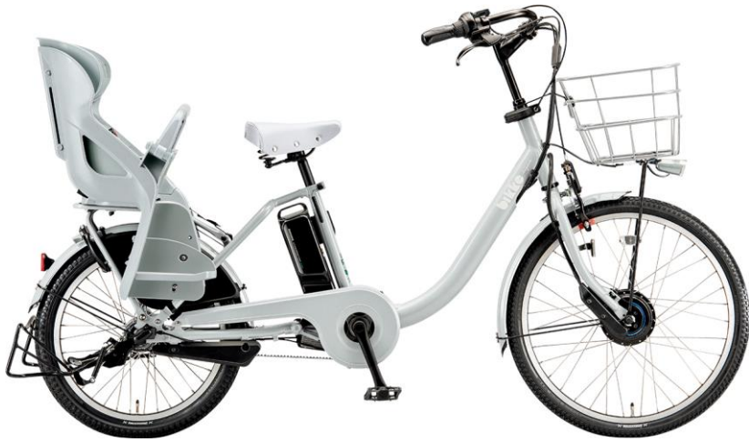
ビッケ モブ dd E.XBK ブルーグレー