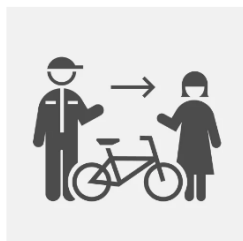
⑤ショップで商品を受け取る