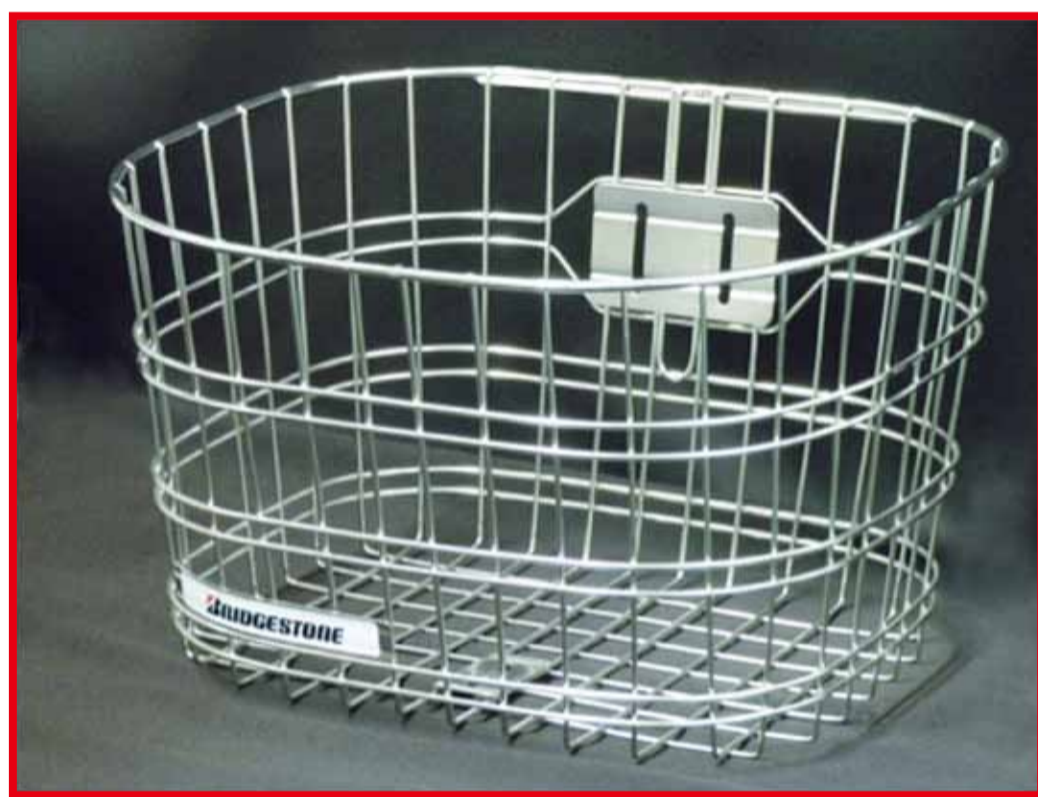
リコール対象バスケット